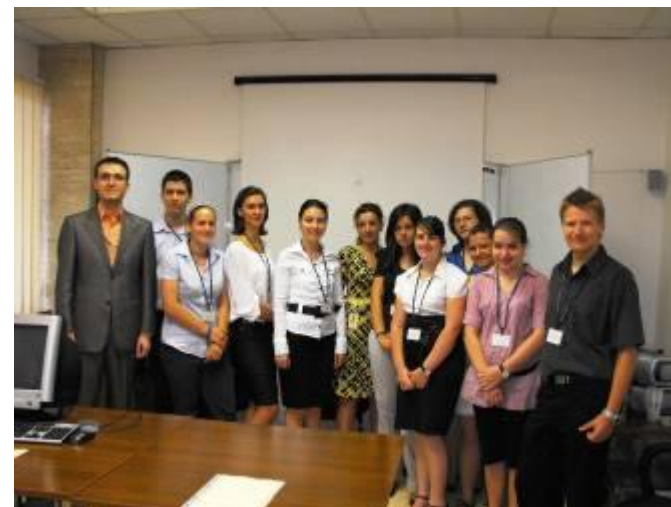
Стажантите в БНБ с техните ръководители

Август 2010 г. В рамките на дългогодишното ни сътрудничество с Българската народна банка и Българската търговско-промишлена палата и за високи постижения в учебния процес, група ученици от X и XI клас участваха в традиционния летен стаж в БНБ и БТПП. За своето отлично представяне учениците получиха сертификати от тези институции.