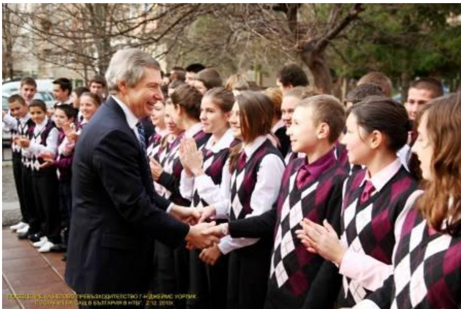
Посрещането на Негово превъзходителство посланикът на САЩ Джеймс Уорлик в Националната търговско-банкова гимназия

Декември 2010 г. Във връзка с Деня на банкера, 6 декември, на посещение в НТБГ беше Негово превъзходителство посланикът на Съединените Американски Щати в България, г-н Джеймс Уорлик. В програмата на посещението беше включена презентация на българо-американските дипломатически отношения, изнесена от учениците от VIII „з” клас и представяне на пет учебни формирания от НТБГ, получили национални и международни отличия през годината. Г-н Уорлик беше силно впечатлен от задълбочените познания на учениците от гимназията. Изказа своето задоволство от отличния английски език на учениците, от тяхната креативност и задълбочени професионални знания и изказа увереност, че с такива прекрасни млади хора България има забележително бъдеще. Той отбеляза, че във всяка дейност залог за успех са хората, които я упражняват да го правят с вдъхновение и страст. Посланик Уорлик получи като подарък от гимназията автентична сурвачка с обяснение, направено от учениците, на този символ на здраве и късмет.