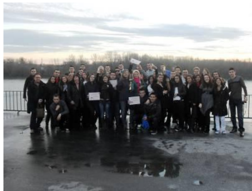
Отборът на НТБГ в Братислава с наградите от панаира