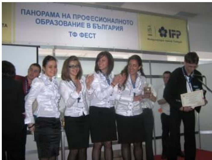
Награждаване на Учебна регионална агенция по приходите

Май 2010 г. Участие на представителен отбор от Националната търговско-банкова гимназия с три учебни фирми на Международния панаир в гр. Базел, Швейцария – „Тандем Джуниър” ООД, „Светът на играчките” ООД и „Премиум ауто” ООД. Голямата награда на панаира за иновация и креативност спечели учебна фирма „Премиум ауто” ООД.