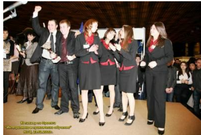
Екипът на Учебна банка „Роял Банк” АД

Март 2010 г. От 23 до 26 март 2010 г. представителен отбор на Националната търговско-банкова гимназия взе участие в две международни състезания в Ню Йорк, САЩ: