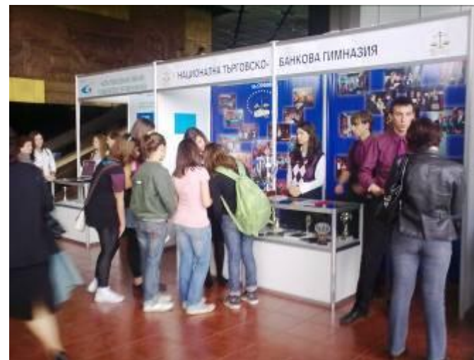
Щандът на НТБГ по време на изложението на училищата беше посетен от много ученици и родители