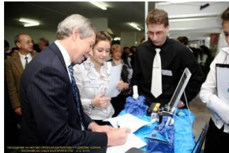
Посланик Уорлик на щанда на Учебната регионална агенция по приходите участва в проучване на формирането за повишаване екологичната култура на гражданите