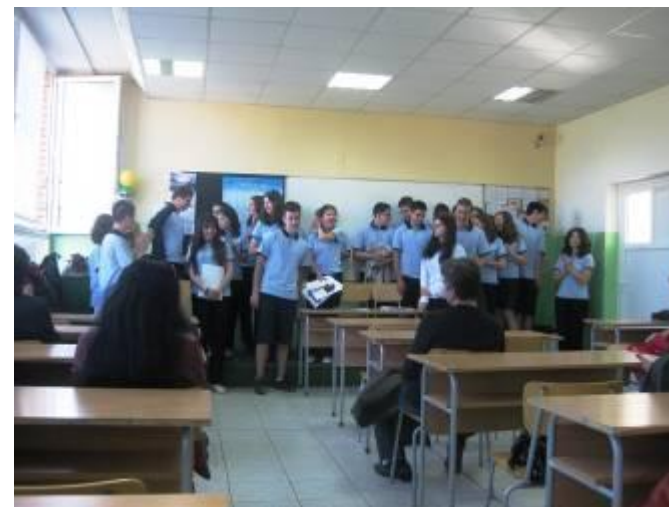
В чест на празника на гимназията учениците от VIII „3” клас подготвиха и изнесоха представление на английски език на „Магьосникът от Оз”