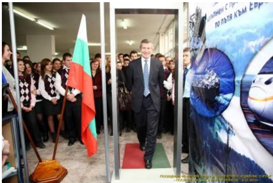
Посланник Уорлик пресича държавната граница на Република България на Щанда на учебна митница „Триадница“.