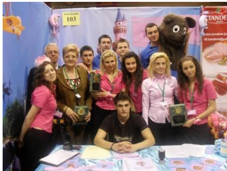
Учениците от Учебна фирма „Светът на играчките” ООД с наградите от панаира в Ню Йорк

Игнатов. Дейностите на нашите ученици бяха оповестени на специална пресконференция в БТА и отразени в различни медии.