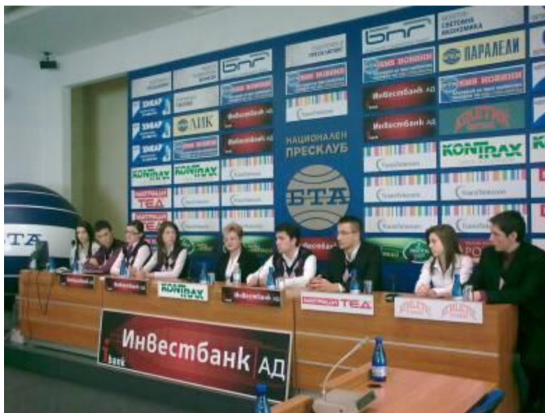
Пресконференцията в БТА