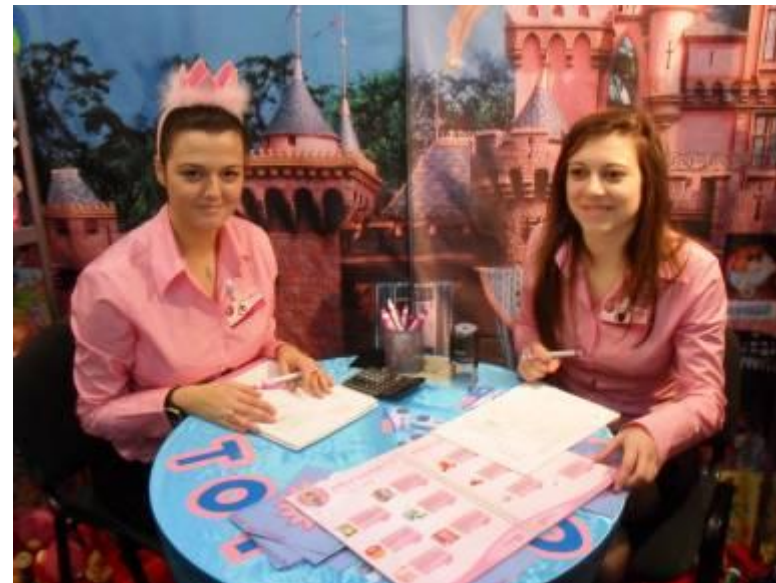
Панаирният щанд на учебна фирма „Светът на играчките“ ООД, заела първо място в генералното класиране