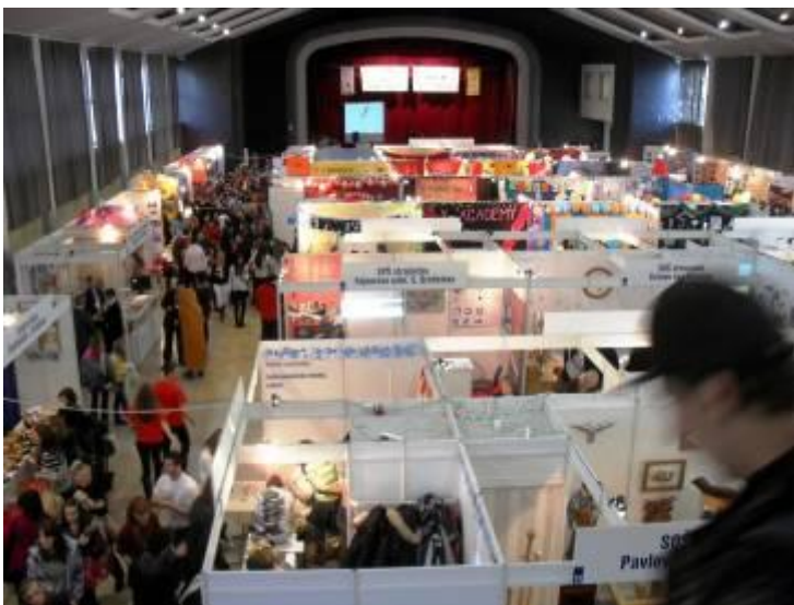
Изглед от панаирната зала в Братислава

Започнал преди дванадесет години проектът „Интегративно практическо обучение“ даде самочувствие на нашите учители и ученици в национален и в международен мащаб.