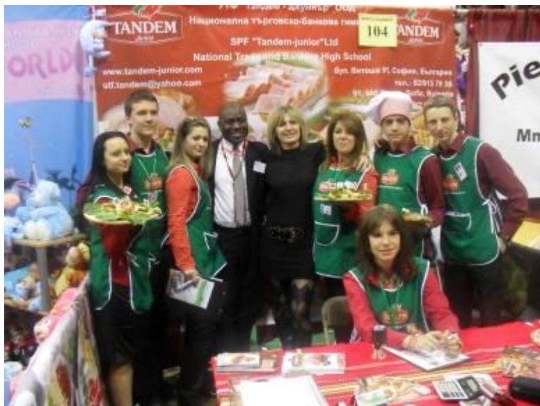
Учениците от учебна фирма „Тандем Джуниър“ ООД на панаирния щанд в Ню Йорк