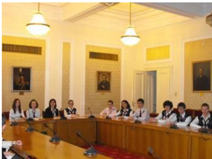
Учениците, по време на заседанието на комисията