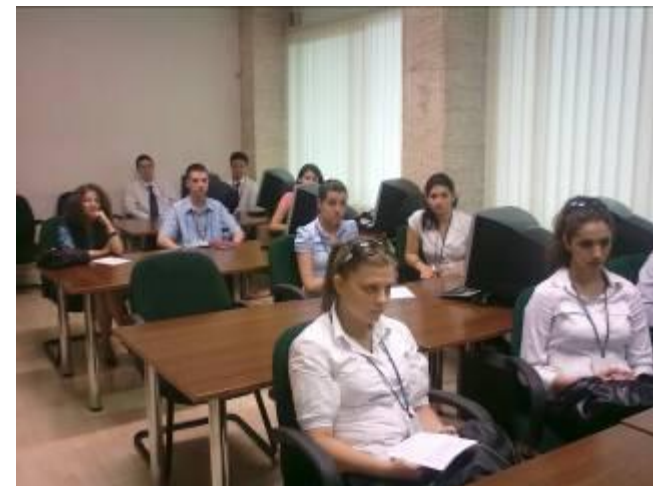
Стажантите на лекция в БНБ