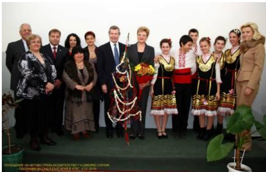
Посланник Уорлик с ръководството на НТБГ, ученици и гости на събитието