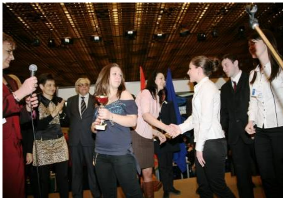
Награждаване на учебна банка „Евро Кредит Банк” АД на Единадесетия панаир по проекта „Интегративно практическо обучение” в зала 3 на НДК