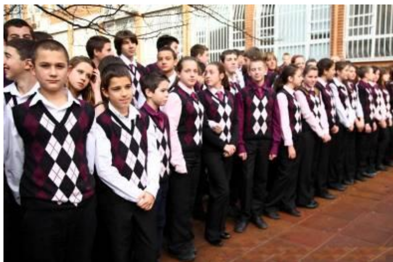
Откриване на учебната 2010-2011 година