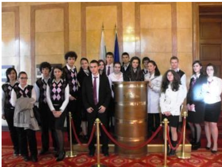
Учениците в кулоарите на Народното събрание

По предложение на Комисията по бюджет и финанси на 41-то Народно събрание ученици от НТБГ, специалност „Банково дело”, бяха поканени на заседание на комисията, на което имаха възможност да се запознаят с нейната дейност.