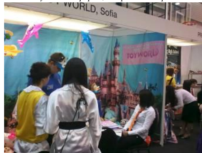
Щандът на „Светът на играчките” ООД