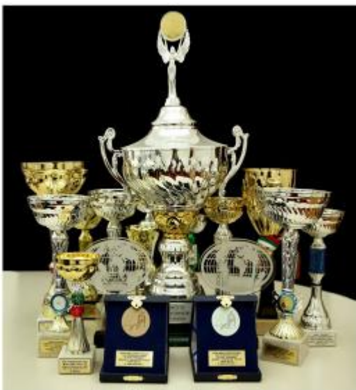
Част от наградите, получени от учениците от НТБГ през 2009-2010 учебна година