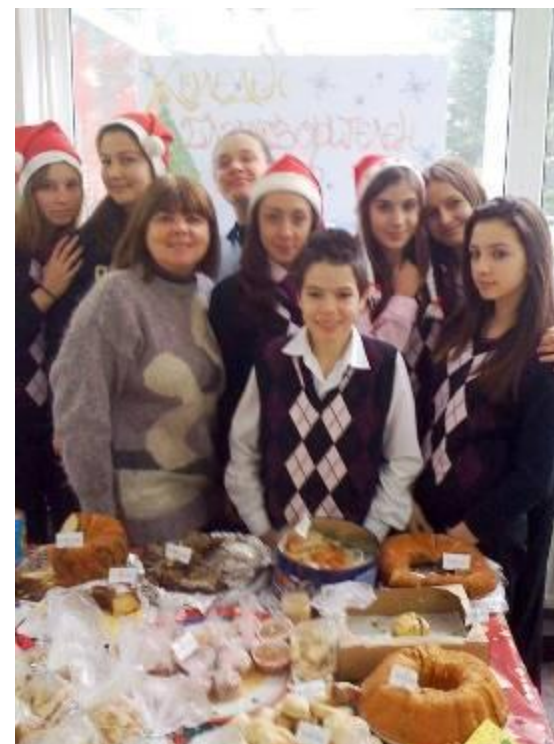
Учениците от VIII „а” клас взели активно участие в Коледния благотворителен базар на 21 и 22 декември 2010 г.

Училищното настоятелство на Националната търговско-банкова гимназия успява през годините на съществуването си да поддържа високи изисквания към образователния и възпитателен процес като спомага осъществяването на иновационни дейности по образованието и възпитанието на учениците, оформяне на собствен облик на училището и изграждане на обратна връзка между училището и обществото.